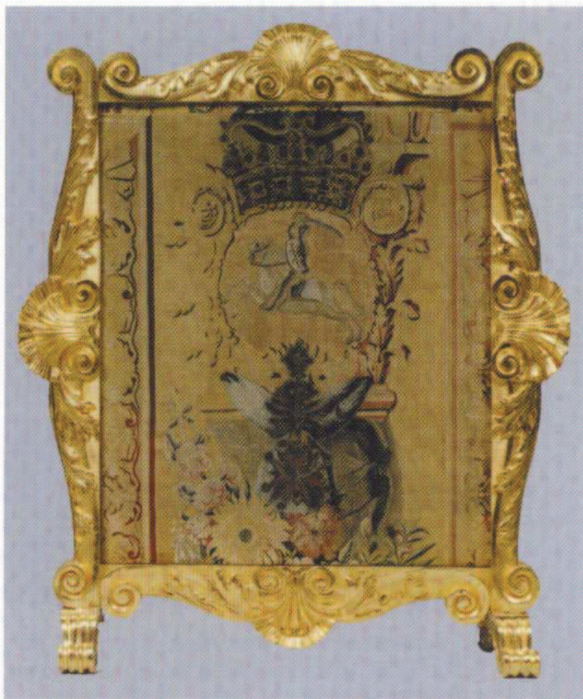
5. Ekran kominkowy po konserwacji, Muzeum - Pałac w Wilanowie Fot. W. Holnicki, 1997 r.

W trakcie badań obiektu okazało się, że górny dosztukowany pas gobelinu nie jest fragmentem innej tkaniny, lecz odciętą od dołu jego integralną częścią. Po odrzuceniu sztukowania ukazała się krajka w kolorze granatowym, stanowiąca techniczne zakończenie tkanego obiektu. Znajdująca się z boków tapiserii analogiczna krajka, oraz pozostawione luźno po odcięciu od krosna osnowy świadczą, że tkanina ma oryginalną szerokość. Od dołu zaś została obcięta, bądź była tkana na zamówiony, właśnie taki wymiar.