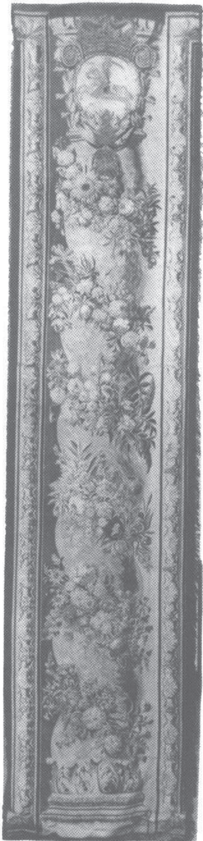
6. Tapiseria herbowa z Pogonią, Drezno, J. Nermot, 1736, wym. 416 x 94 cm, Muzeum Czartoryskich w Krakowie. Fundacja Książąt Czartoryskich przy Muzeum Narodowym w Krakowie.