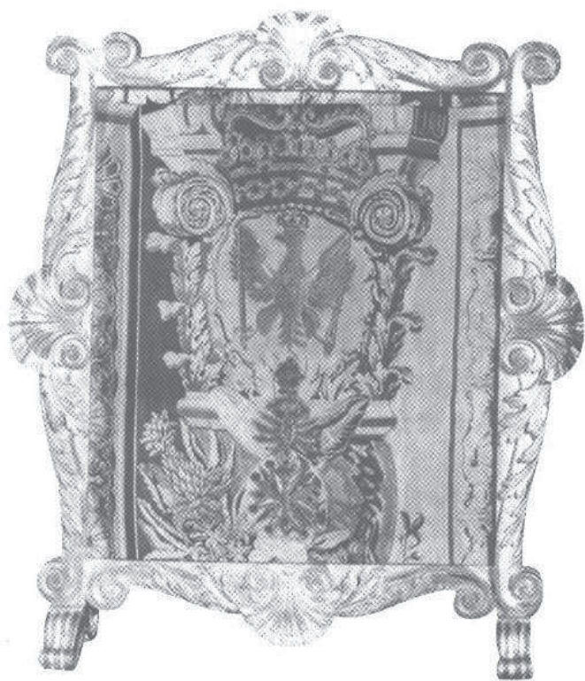
1. Ekran kominkowy z tapiserią z herbem Orzeł, Dreżno, Jacques Nermot, ok. 1730 – 35, wym. 110 x 94 cm. Muzeum – Pałac w Wilanowie. 1971 r.

pod królewską koroną, z emblematami herbowymi na tle zarysu kompozytowego kapitelu kręconej kolumny. Niżej, na wstędze, orderzy Złotego Runa i Orła Białego. U dołu na tle trzonu kolumny różnorodne kwiaty i trawy. Całość obramowana jest bordiurą imitującą ramy obrazu wypełnione muszlami. Wymiary tapiserii: 110 x 94 cm. Oba obiekty od góry są sztukowane. Materiałem tkac-