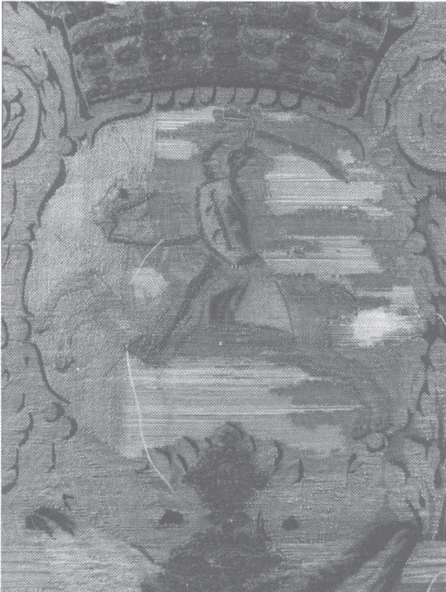
4. Fragment tapiserii z herbem Pogoń, stan w trakcie konserwacji. Fot. B. Zych, 1992 r.

czenie tej kruchej substancji przed całkowitym unicestwieniem (il. 4).