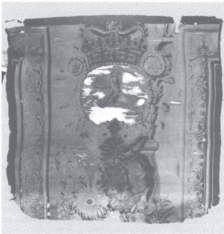
3. Fragment tapiserii z herbem Pogoń, stan w trakcie konserwacji, po demontażu. Fot. B. Seredyńska, 1989 r.

kim jest przędza lniana w osnowie (10 na 1 cm), oraz przędza wełniana, jedwabna i jedwabna z opłotem srebrnym w wątku (24-28 na 1 cm).