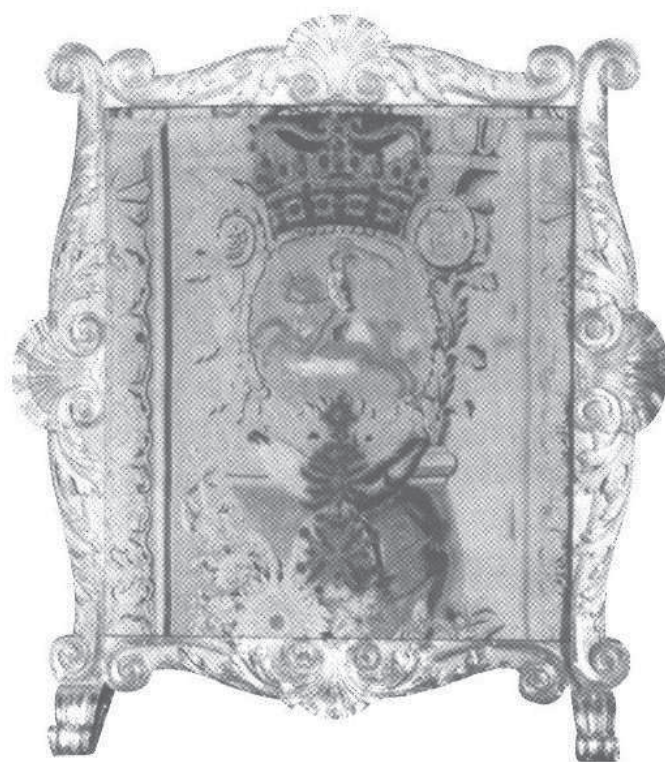
2. Ekran kominkowy z tapiserią z herbem Pogoń, Dreżno, Jacques Nermot, ok. 1730- 35, wym. 110 x 94 cm. Muzeum – Pałac w Wilanowie. Fot. Z. Błażejewska, 1971 r.