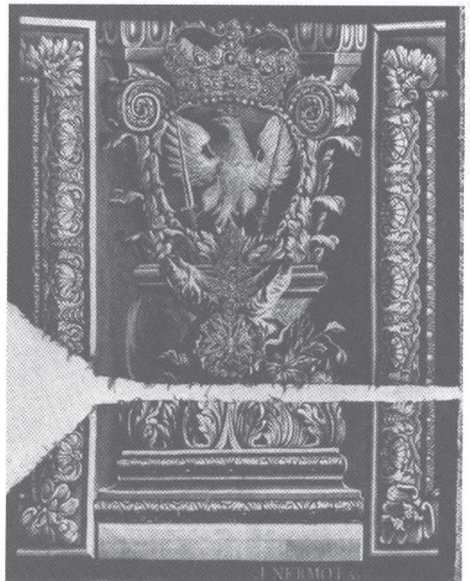
7. Tapiseria herbowa z Orłem, Drezno, J. Nermot, 1735, Muzeum w Moritzburgu (zaginiona).