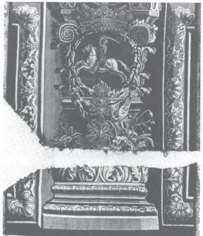
8. Tapiseria herbowa z Pogonią, Drezno, J. Nermot, 1735, Muzeum w Moritzburgu (zaginiona). Repr. W. Holnicki z H. Göbel, Die Wandteppiche, t. 3, cz. II, Leipzig-Berlin 1934 r.